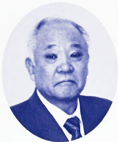
大阪府中華料理 生活衛生同業組合