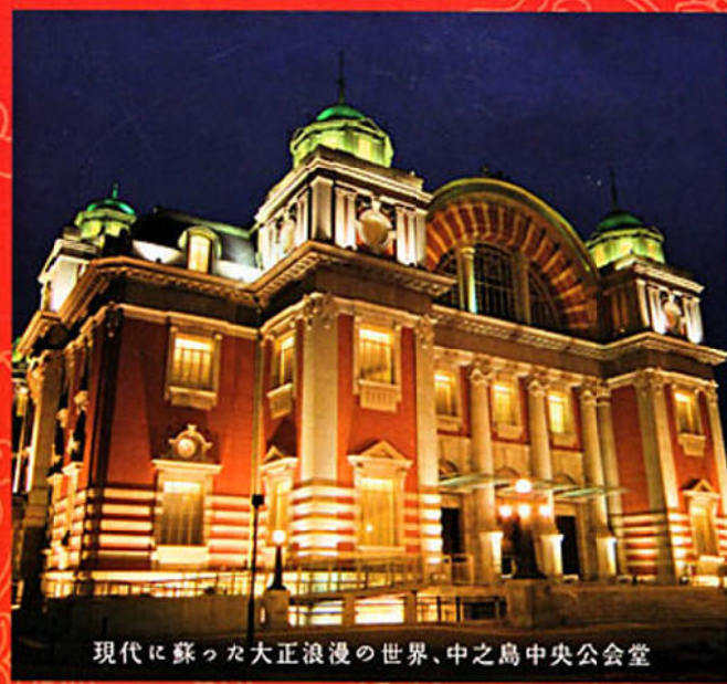
現代に蘇った大正浪漫の世界、中之島中央公会堂