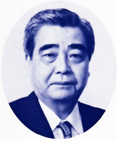
全国中華料理生活衛生 同業組合連合会